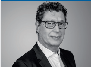
dasWERK Pro Mittelstand – unkompliziert zu mehr Liquidität

Viele Sanierungsvorhaben scheitern aufgrund mangelnder Liquidität. dasWERK schafft neue Handlungsspielräume, auch in der Krise. Bundesweit tätig, verfügen die Spezialisten bei dasWERK über wertvolles Know-how in Krisensituationen.