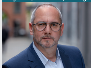
FRAMEWORK INTERIM MANAGEMENT

Um Gas zu geben, muss auch der Motor laufen!