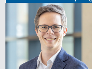
appliedAI Mit KI die Zukunft gestalten